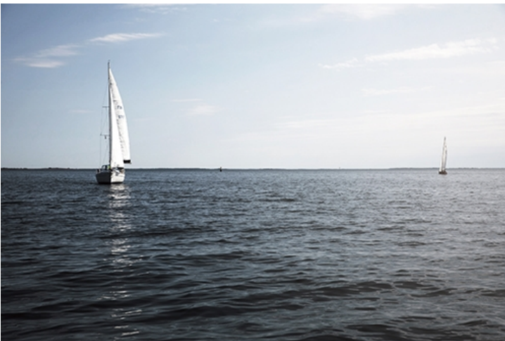
Ahvenanmaan saaristo sijaitsee keskellä maailman suurinta saaristoaluetta ja monia väyliä - täällä on useita kauniita lahtia sekä tuhansittain saaria.