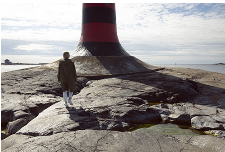
Majakka Marhällan vuodelta 1938, joka sijaitsee Maarianhaminaan johtavalla väylällä.